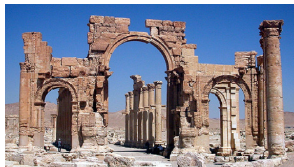
Hadrianstor mit Kolonnade in Palmyra, 2015 zerstört

daraus ersichtlich, dass die EU das Jahr 2018 zum Europäischen Jahr des kulturellen Erbes ausgerufen hat und rund acht Millionen Arbeitsplätze mit dem